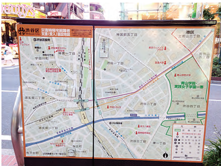
災害時帰宅困難者支援（受入）施設地図