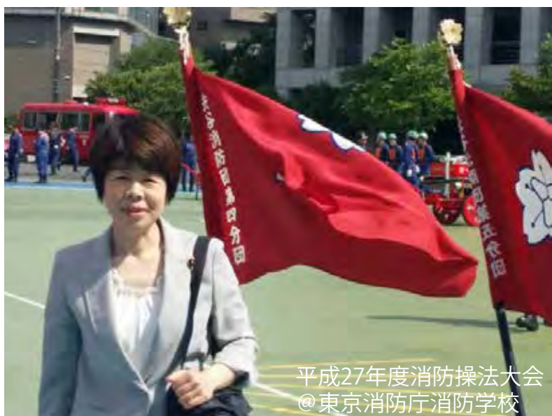
平成27年度消防操法大会 @東京消防庁消防学校